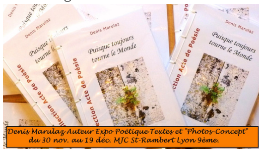
Denis Marulaz Auteur Expo Poétique Textes et "Photos-Concept" du 30 nov. au 19 déc. MJC St-Rambert Lyon 9ème.

Denis Marulaz expose ses poèmes et photographies à la MJC du 9ème Saint Rambert. du 30/11 au 19:12 avec un vernissage en voix mardi soir.